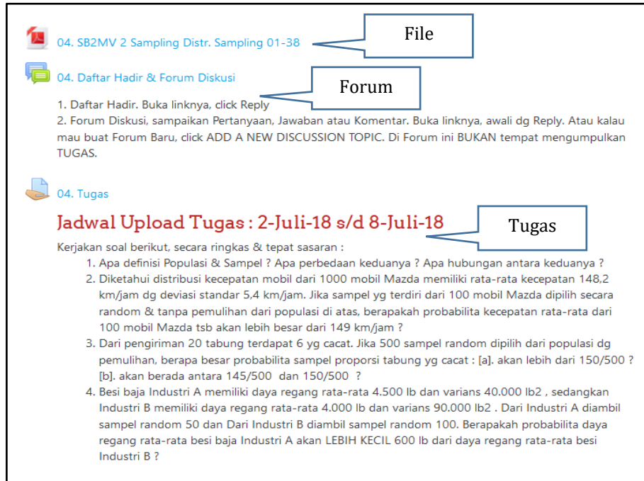
Gambar 1. Tampilan 3 (tiga) konten materi ajar e-learning (File, Forum dan Tugas)

Hasil pemeriksaan setiap Kamis pagi yang dikumpulkan dan dianalisa, sehingga bisa mendapatkan gambaran bagaimana dan seberapa tepat Dosen mengunggah materi ajar e-learning berdasarkan konten dan ketepatan waktu. Format atau bentuk pengamatan berupa Gambar 2 berikut.